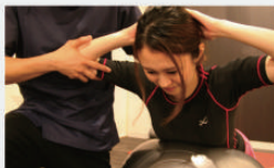
パーソナルトレーニング

アスリート・スポーツをされる方・キレイになりたい方・体力に衰えを感じる方・身体に不安をお持ちの方へ